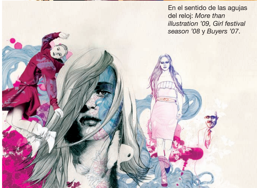
En el sentido de las agujas del reloj: More than illustration '09 , Girl festival season '08 y Buyers '07 .